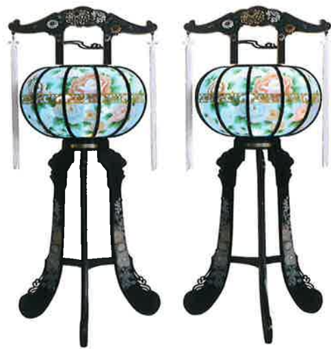
回転灯呂(ブラック)

笠岡ホール葬 28,700円(高さ150cm) 矢掛ホール葬・自宅葬 23,200円(高さ100cm)