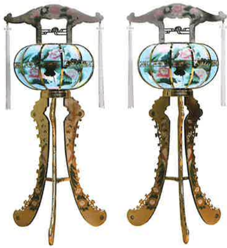
回転灯呂(ゴールド)

笠岡ホール葬 28,700円(高さ150cm) 矢掛ホール葬・自宅葬 23,200円(高さ100cm)