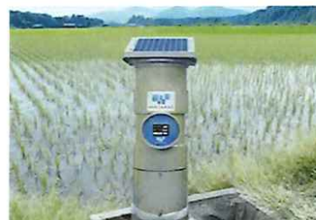
圃場水管理 システム