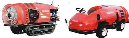
スピード スプレーヤー