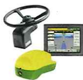
自動操舵システム