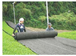
茶の被覆作業の実施