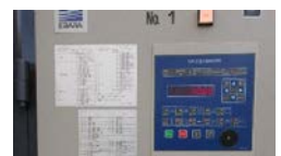
環境制御盤の導入