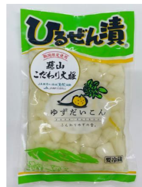
蒜山こだわり大根の浅漬け