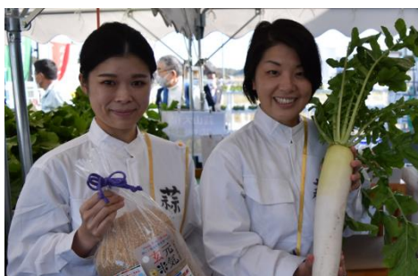
ひるぜん大根ガールズ