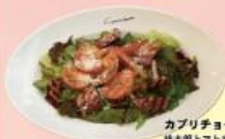
カプリチョーザ 桃太郎トマトサラダ カボチャナール ¥1,050(税込) ¥1,200(税込)