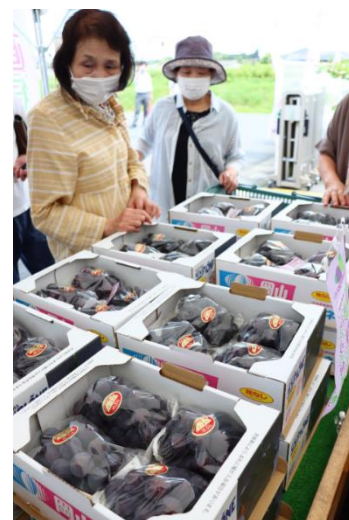
JA選果場発！ぶどうの旬感移動 晴ればれ直行便