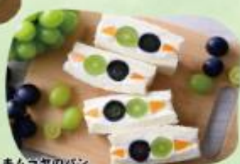
キムラヤのパン フルーツサンド (シャインマスカット&ビオーネ) ¥388(税込)