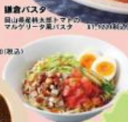
鎌倉バスタ 岡山産産地直産トマトの マルゴザリサラダ ¥1,980(税込)