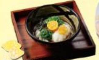
ぶっかけずるいち 自然熟レモンを添えたおろしぶっかけ ¥820(税込)