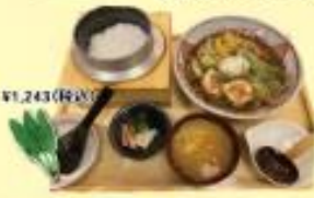
ぶっかけずるいち/海鮮寿司しなみ おにぎり/シャリ、朝日米