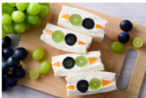
岡山木村屋とのコラボ商品「フルーツサンド」