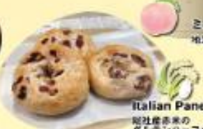
Italian Panetteria carino 岡山産産地の グルテンハーフベグル ¥324(税込)