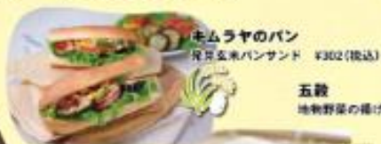
キムラヤのパン 桃片玄米パンサンド ¥302(税込)