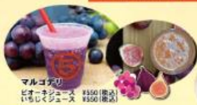
マルゴザリ ビオーネジュース ¥550(税込) いちじくジュース ¥550(税込)