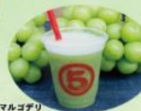
マルゴザリ シャインマスカットジュース ¥600(税込)