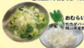
おむらいつ草 桃太郎パフェ 岡山産産地直産が登場