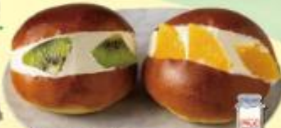
ブレッドガーデン 岡山牛乳 マリトッフォ ¥439(税込) 岡山牛乳 コッペのフルーツサンド ¥439(税込)