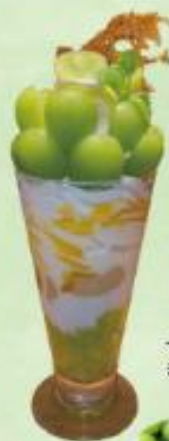
三河屋珈琲 岡山マスカットパフェ ¥1,320(税込)