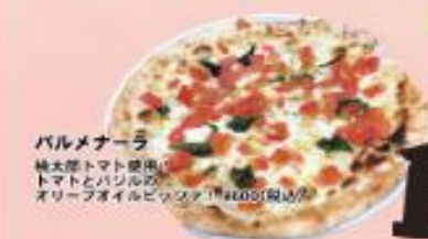
パルメナール 桃太郎トマト使用の トマトとパスタの オリーブオイルピッツァ ¥1,400(税込)