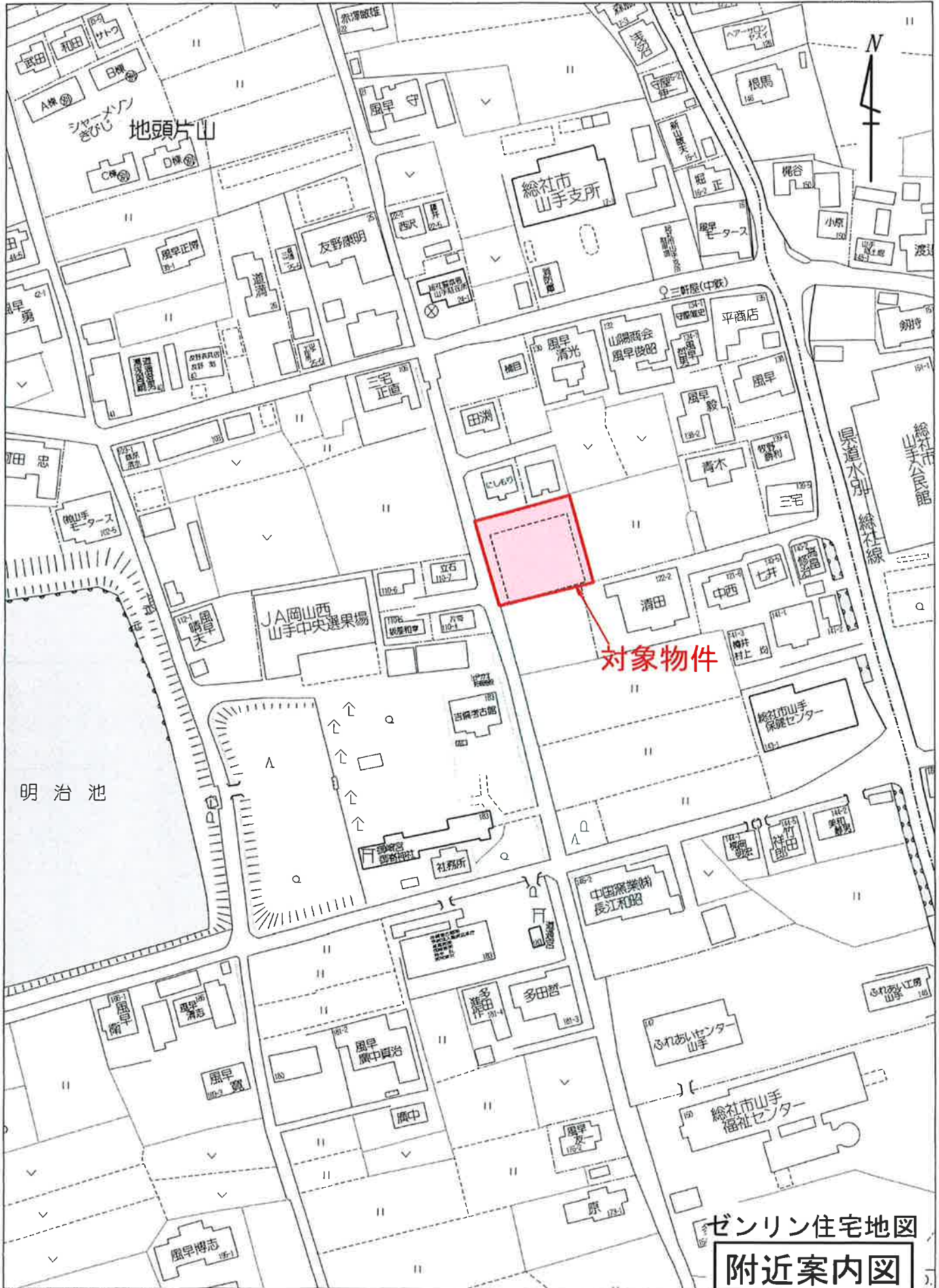
総社市地頭片山付近